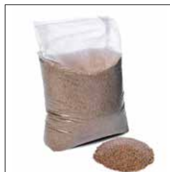
Kwartzand (25 kg per zak)