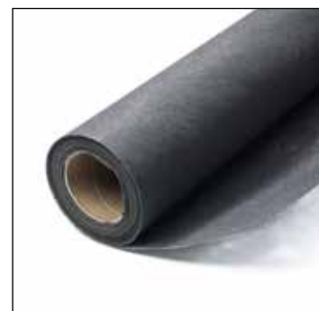
Drukverdelend doek (50 x 2 m)