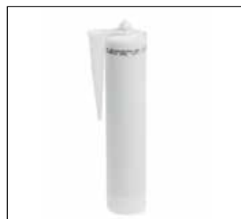
Lijmkoker (290 ml inhoud)