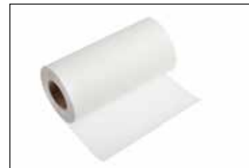
Rollen lijmband (100 x 0,2 m)