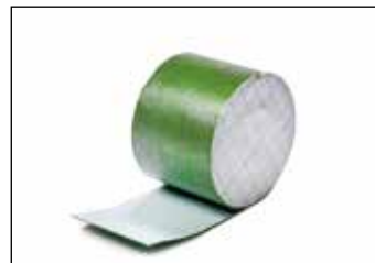
Zelfklevend lijmband (10 x 0,12 m)

Door kunstgras met circa 8 kg per m 2 kwartzand in te strooien, blijft het kunstgras beter rechtop staan. Het gewicht van het zand voorkomt het krimpen van het kunstgras.